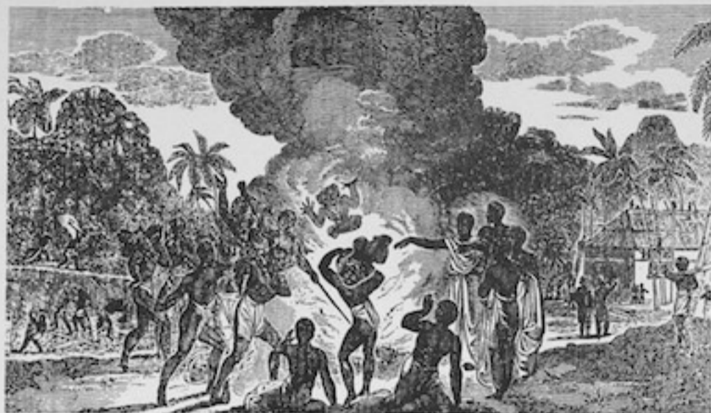
I muri a'e i te tama'i no Fe'i Pi , ua tavaohi haere-hia te mau marae, ua taninahia te mau ti'i ra'au i te auahi. Ua fa'aru'e-hia ho'i te mau ti'i 'ofa'i i roto i te miti. Ua fari'u roa ia te nuna'a maita'i i taua ihoa fa'aro'o "ha'amori 'itoro". Mai reira ato'a mai te mana-hope o te Ari'i Pomare II.

E fa'aru'e-ohie noa te ha'amori 'itoro i to ratou mau atua 'itoro, e vavahi-hia ho'i te mau marae, e taninahia te mau ti'i ra'au i te auahi, e fa'aru'e-hia atu te ti'i 'ofa'i i roto i te miti, e haere iti roa atu ai te mau peu 'etene e