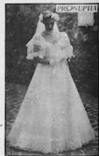
ROSES DE MARIÉE PRONUPTIA EN VENTE AUX ETS. BEAUMONT A CÔTÉ DU MARCHÉ DE PAPEETE