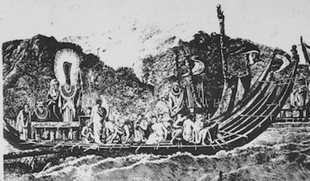
Ua tatau'a o 'Opuhara i tona nu'u i na tuha'a e toru. Ona iho te arata'i i te nu'u o te na tai i te tem atu i Pa'ea. Na Ta'a tarua e arata'i i te pae nu'u e na uta atu i te haere.

raua iho mau mauha'a fama'i ma te fa'aitoito-