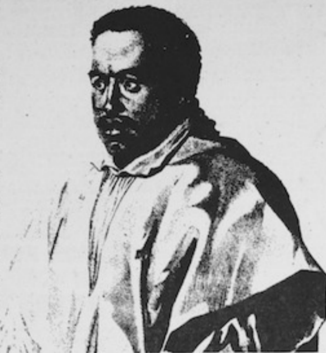
Noa au, tona pas i te nu'u o Opuhara e piti taime e'ita o Pomare II (Tu e tu'u e pas roa atu ai te nu'u o Opuhara i tona i te 12 no novema 1815 i roto i te tama'i no Fe'i Pi.

Te ui maere noa-hia ra a i teie mahana, e aha te tumu i ma'iri-hia ai taua tama'i ra, te tama'i Fe'i pi. Tae roa mai i teie