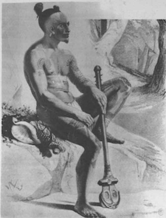
'Aita e hoho'a no 'Opuhara e vai nei. E'ita ra paha e 'ore tona huru mai to teie 'Aita no taua tau ra. E ta'ata tino tupura'a rahi pautuutu e te puai rahi o 'Opuhara. E toru a'e ta'ata no teie tau e mara'a ai tana niu (omore) i te amo.

Tati i taua taime ra i te vaira'a i muri a'e i te rirora'a atu tona ti'ara'a ia Pomare.